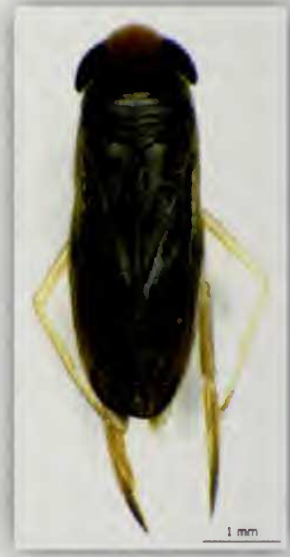
Fig. 3.- Habitus de Sigara (Vermicorixa) lateralis (Leach) (♂)

Es común en pequeños remansos, pozas y charcas temporales aunque también puede localizarse en los enclaves leníticos permanentes (presas o estanques artificiales y semiartificiales, obras de infraestructura de regadío...) Además, a veces, puede encontrarse en las aguas ligeramente salobres. Es, junto con Corixa affinis Leach, uno de los elementos faunísticos estudiados que denota una mayor euricidad en el archipiélago canario.